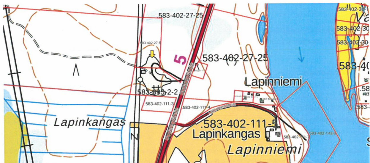
Kuva 2. Karttaote tarkastettavasta kiinteistöstä ROSKALA 583-402-27-5 minne purkujätettä kuljetetaan, ja jossa on toiminnanharjoittajan mukaan tarkoitus murskata jäte myöhemmin. Keltaisella nuolella on merkitty Purkujätteen sijainti.