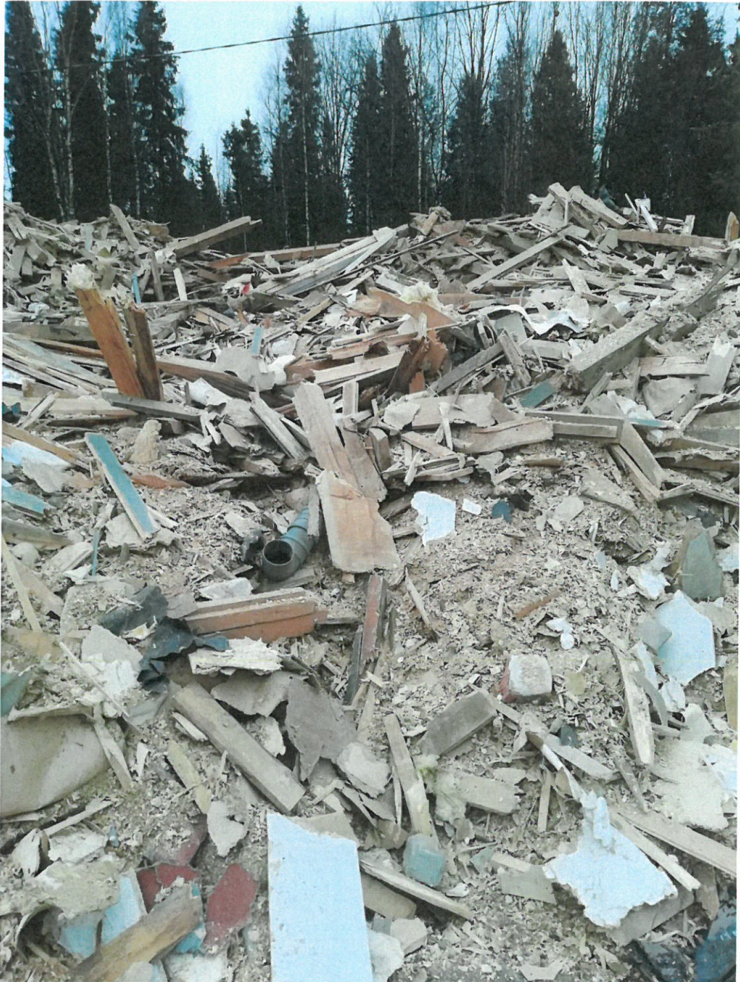
Kuva 5. Purkujätettä, joka on kuljetettu kehotuksesta huolimatta kiinteistöltä sodankyläntie 16 (583-402-38-49), murskausta varten kiinteistölle ROSKALA (583-402-27-5).