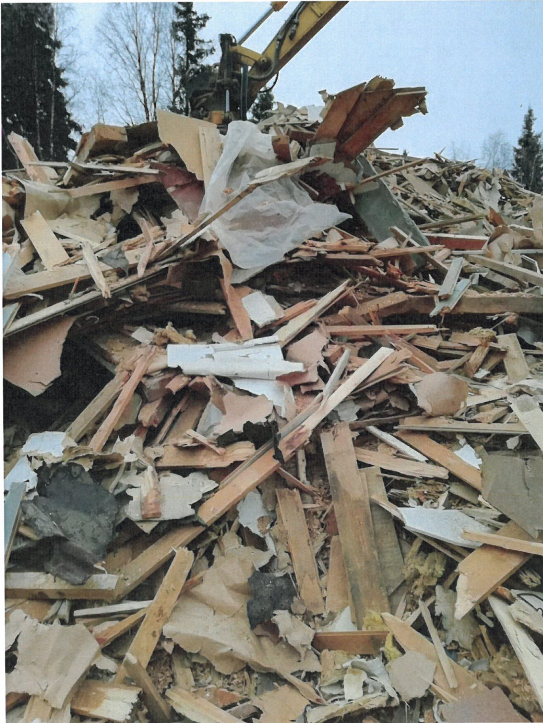
Kuva 8. Purkujätettä, joka on kuljetettu murskattavaksi kiinteistölle ROSKALA (583-402-27-5).