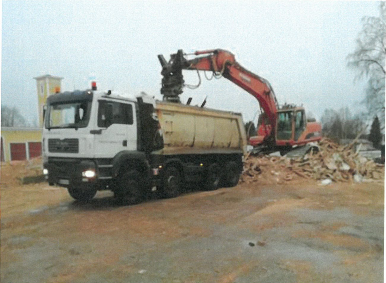
Kuva 3. Kiinteistöllä Sodankyläntie 16 (583-402-38-49) olevaa purkujätettä, jota kuljetettiin edelleen 3.11.2022 ilman hyväksyntää jätehuoltorekisteriin.