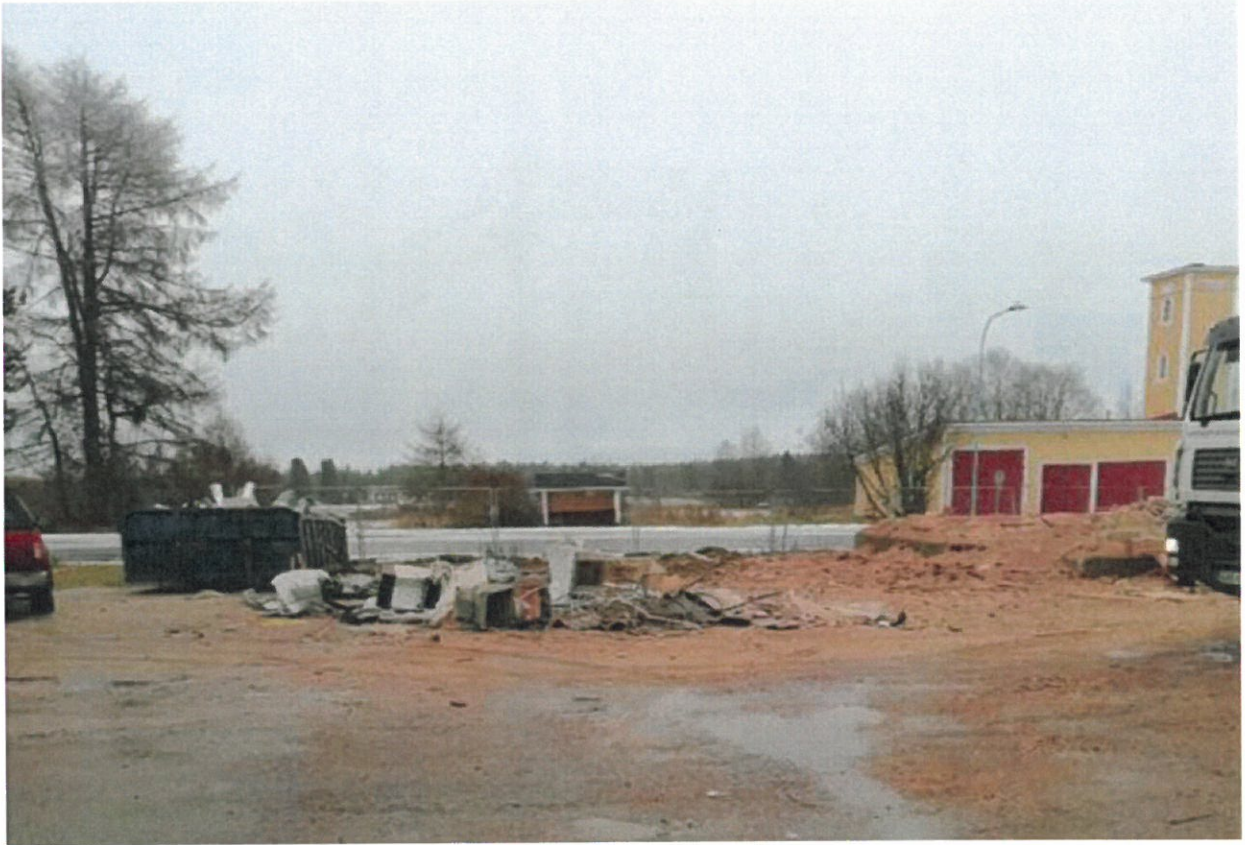
Kuva 4. Purkujätettä oli toiminnanharjoittajan mukaan siirretty kiinteistöltä Sodankyläntie 16 (583-402-38-49) jo 50-70 kuormaa, vaikka toiminta kehoitettiin lopettamaan ympäristönsuojeluviranomaisen toimesta 1.11.2022.