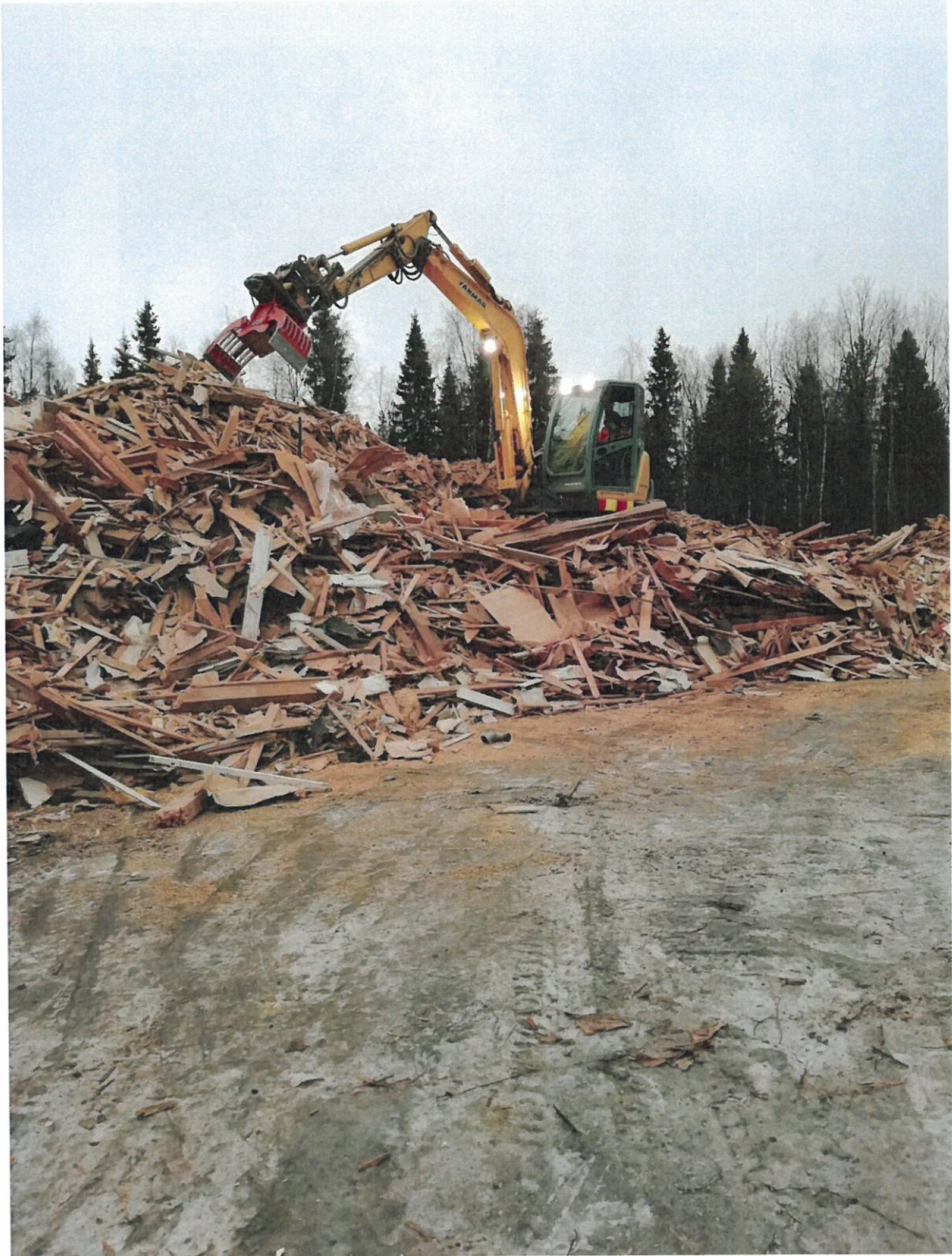
Kuva 6. Purkujätettä, joka on kuljetettu murskattavaksi kiinteistölle ROSKALA (583-402-27-5).