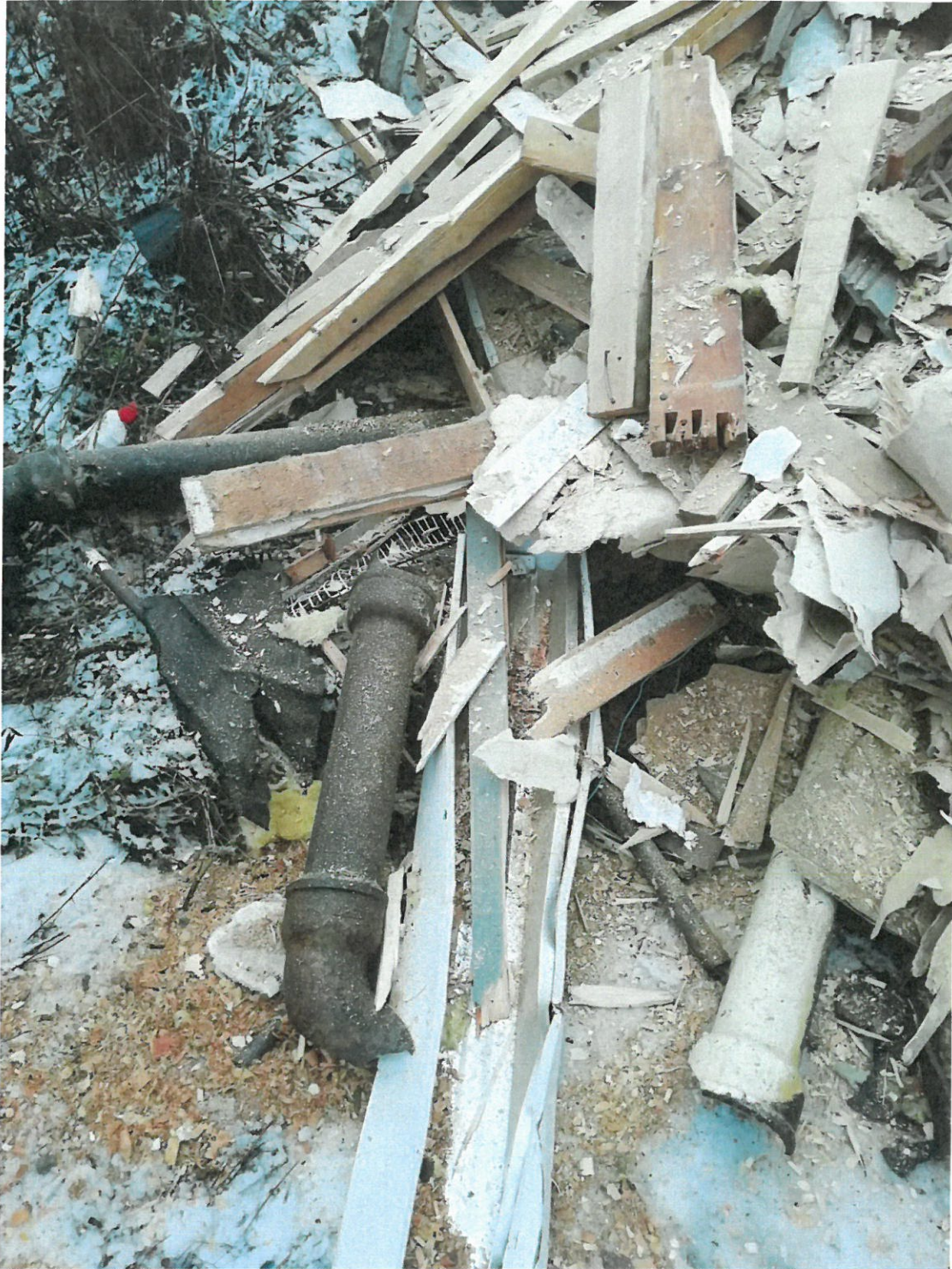
Kuva7. Purkujätettä, joka on kuljetettu murskattavaksi kiinteistölle ROSKALA (583-402-27-5).